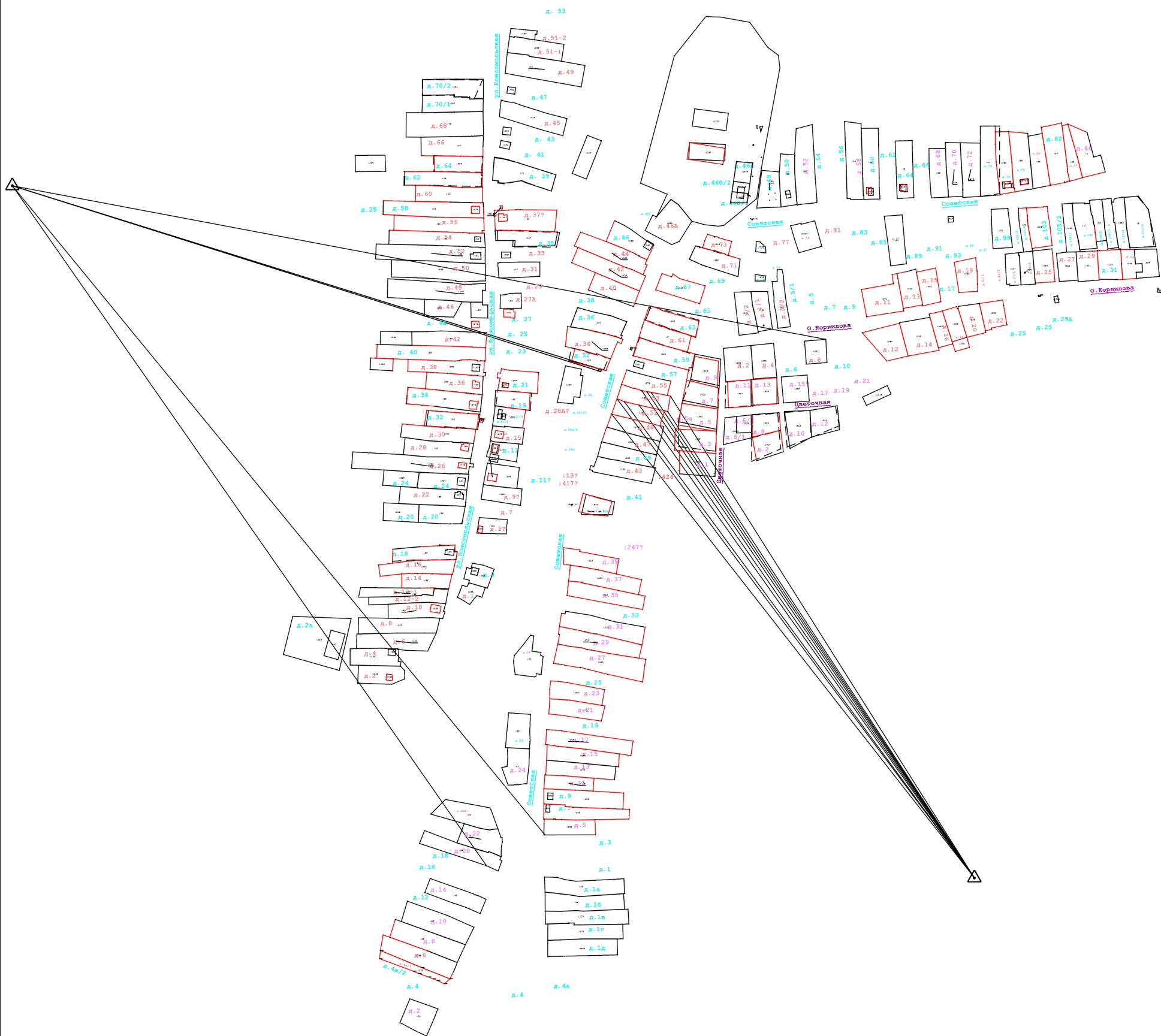
Схема геодезических построений